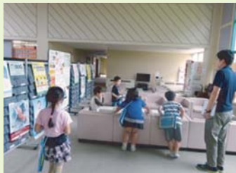
レッツゴー町探検