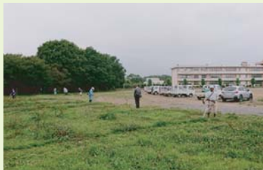
シニアクラブ 小中学校での社会奉仕活動