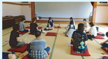
(幼児安全法講習風景)