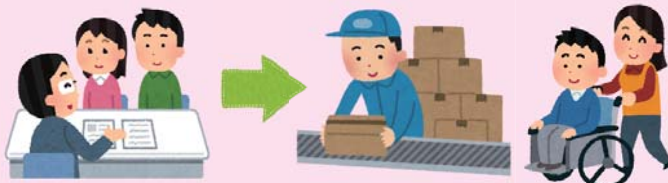
(就労支援・福祉サービス)