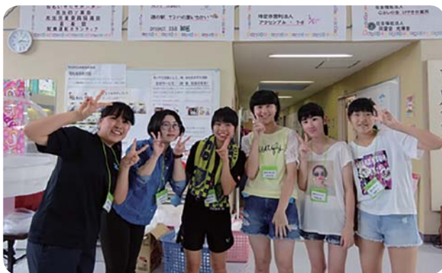
大活躍のJLCメンバー

ソーシャルフェス～いちかいまちの福祉のおまつり～2019が8月23日に、市貝町保健福祉センターで開催され、約650人の来場者でにぎわいました。